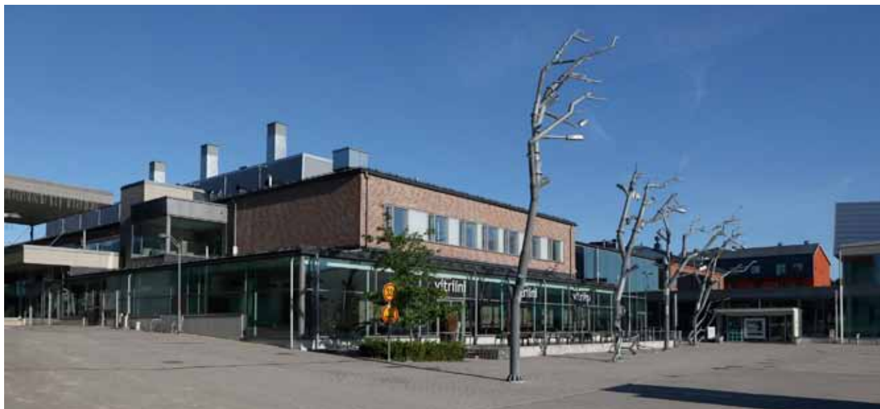
Konstfabriken, Västra Alexandersgatan 1