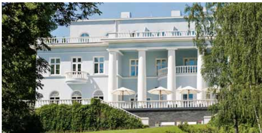
Huvudbyggnaden vid Hotell Haiko gård.