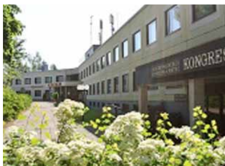
Zonta-kiintiön Standard-huoneet sijaitsevat hotellin kylpylä- ja kongressisiivessä.

HUOM! Mahdolliset kylpylähoidot on tilattava 25.9 mennessä osoitteella www.haikko.fi jolloin hotelli tarjoaa 15 % alennuksen kaikista yksilöhoidoista varauskoodilla "Zonta". Hoitoja on rajoitetusti saatavilla.