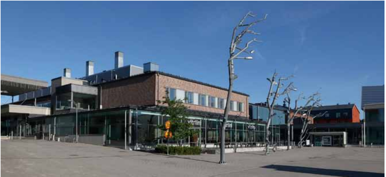
Taidetehdas, Läntinen Aleksanterinkatu 1