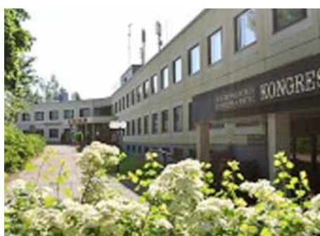
Zonta-kvotens Standard-rum ligger i hotellets spa- och kongressflygel.

OBS! Eventuella spa-behandlingar måste beställas i förväg, senast 25.9, via adress www.haikko.fi . För personliga behandlingar erbjuder hotellet en rabatt på 15 % då man bokar med bokningskoden "Zonta". Endast ett begränsat antal spa-behandlingar får plats.